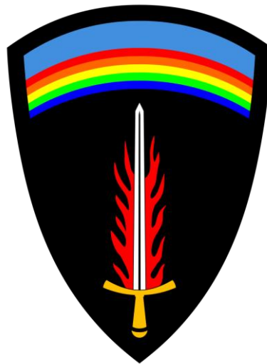
Das Wappen der Supreme Headquarters Allied Expeditionary Force (S.H.A.E.F.)

In der mutmaßlich terroristischen Gruppe um Heinrich XIII. Prinz Reuß wurden neben „Reichsbürger“-typischen Überzeugungen (z.B. S.H.A.E.F.-Ideologie) auch Verschwörungsnarrative geteilt, die in anderen Phänomenbereichen kursieren (z.B. Überzeugungen der QAnon-Bewegung).