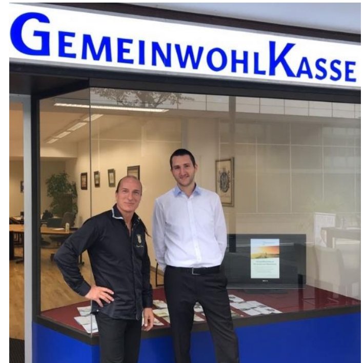
Die „GemeinwohlKasse“ steht im Zentrum des Finanz- und Wirtschaftssystems von Fitzeks Fantasiestaat